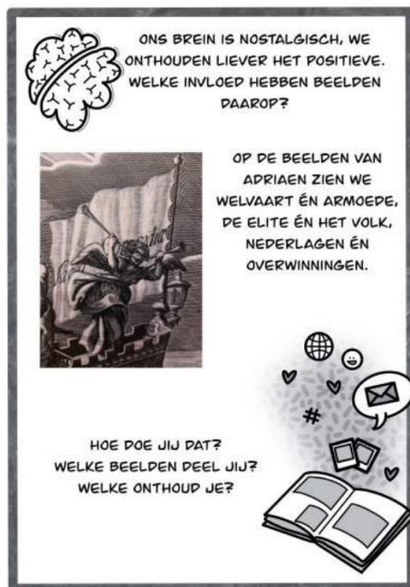
Fig. 3: Opdracht uit Denkwerk. Educatie Zeeuws Museum, Denkwerk. Middelburg, 2023, p. 110. < https://www.zeeuwsmuseum.nl/nl/plan-je-bezoek/nu-in-het-museum/activiteiten/tekenwerk_denkwerk_dichtwerk/denkwerk-010-april-2-3-mb.pdf >.

In Denkwerk ligt de focus van de opdrachten op het denkwerk dat leerlingen vanaf veertien jaar kunnen doen voor ze een afbeelding kiezen om daar een embleem bij te maken (Fig. 3).