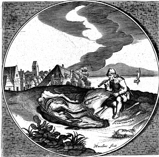
Fig. 1: 'Ex morte levamen' uit Jacob Cats' Sinne- of minnebeelden. Middelburg, 1627, p. 280. < https://emblems.hum.uu.nl/c162747.html#p1 >.

Dat schinct, en drinct, en klinct, dat geeftet al ten besten, Dat singht, en springht, en vinct, dat vogelt, jaegt, en vist; Ontydlick gespaert, onnuttelick ghequist.