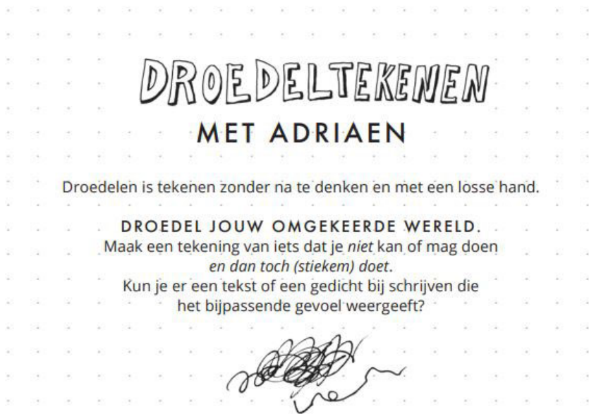
Fig. 2: Opdracht uit Tekenwerk. Educatie Zeeuws Museum en Urban Sketchers, Tekenwerk. Middelburg, 2023, p. 17. < https://www.zeeuwsmuseum.nl/nl/plan-je-bezoek/nu-in-het-museum/activiteiten/tekenwerk_denkwerk_dichtwerk >.

Kinderen vanaf tien jaar worden in Tekenwerk uitgenodigd een embleem op te bouwen vanuit iets wat ze zelf tekenen (Fig. 2).