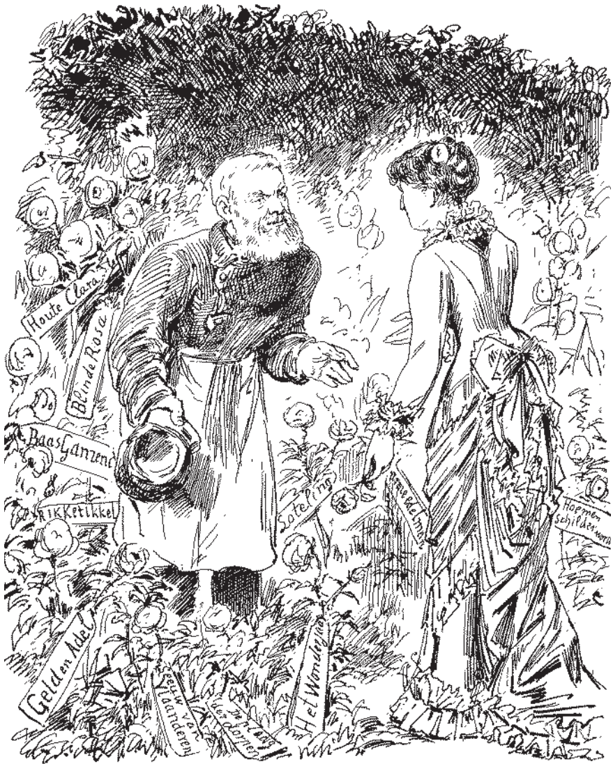
Fig. 2: 'In den Vlaamschen letterhof. Consciencefeest, 25 Sept. 1881'. Volgens het onderschrift zegt Litteratura tegen Conscience: 'Gij moogt trotsch zijn, hovenier, op uwe bloeiende rozen, wij vergeten daarbij die éene waaraan "het ongediert" heeft geknaagd.' Hiermee verwijst de liberale Nederlandsche Spectator -redactie naar Conscience's omwerking van zijn In 't wonderjaar (1837), om deze in 1843 opnieuw verschenen roman in lijn te brengen met een orthodox katholicisme. Anonieme lithografie in De Nederlandsche Spectator , 24 september 1881.